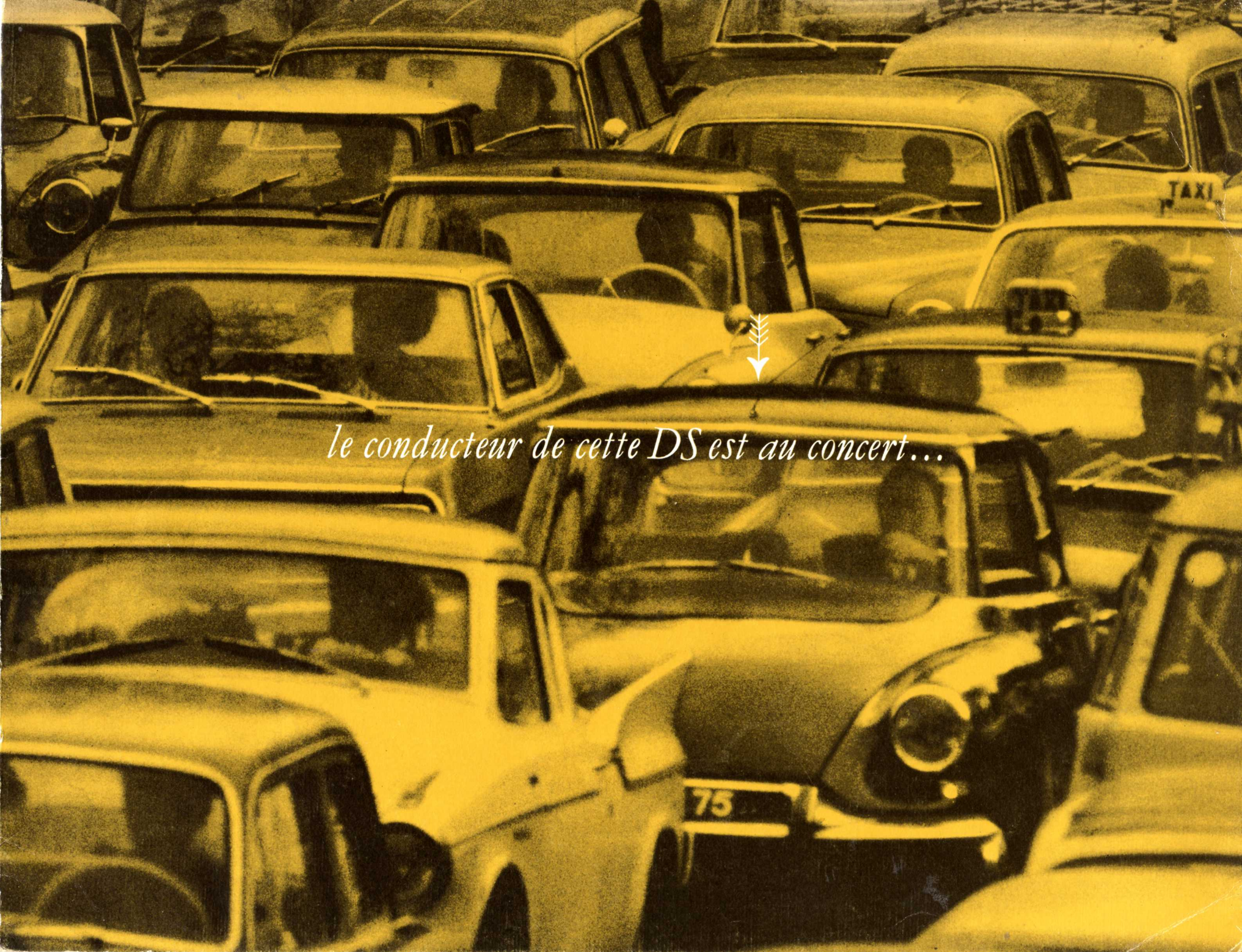
le conducteur de cette DS est au concert...